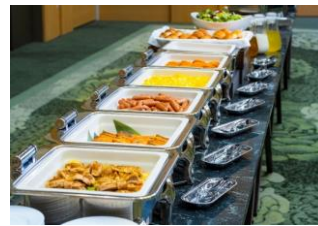
ブッフェレーンイメージ