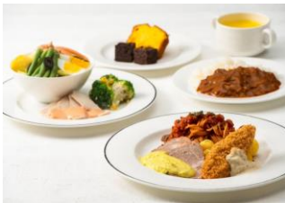
夕食取り分け時イメージ