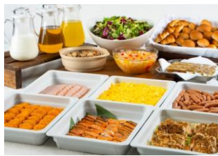
朝食ブッフェイメージ